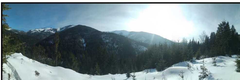
Obrázok číslo 3: Beňuška v zime