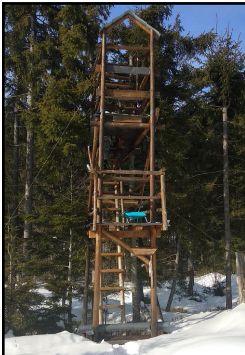
Obrázok číslo 6: Vyhlídková veža, Údolie Gavalierov