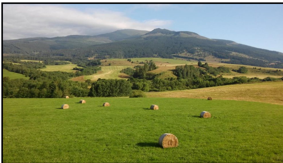
Obrázok číslo 2: Príroda neďaleko Telgártu v lete