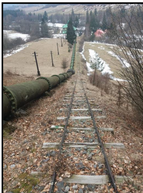
Obrázok číslo 7: Jasenianska kaskáda